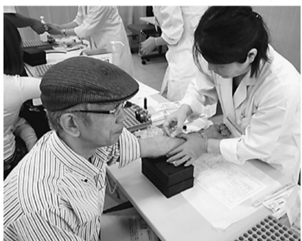
今年度、第1回目の「集団健診」を左記の要綱で開催します。

今年度、第1回目の「集団健診」を左記の要綱で開催します。仕事とくらしを豊かにしていくために、早期発見・早期治療を心がける健康診断を受診しましょう。 【とき】 5月31日(日) 受付9時30分～11時45分 【ところ】 三鷹公会堂「さんさん館」 【申込期限】 5月8日(金)まで 定員300人になり次第締め切り ●集団健診の申込書に記入し、組合事務所まで申込みをお願いします。受診出来るのは、東京土建三鷹武蔵野支部の「組合員」と「家族」のみです。 ●基本健診は、本人・家族とも無料です。無料となるのは、土建国保加入者で、74歳までの方と、家族(19歳以上)。しかし、今年度、すでに受診された方は有料となります。その場合の基本健診は4500円。 ●受診券(新保険証の下の部分)は、健診当日に、必ずお持ちください。保険証に付いています(カード型)。 ●オプション検診費用、受診料金が発生する方は、当日お支払いをいただきます。