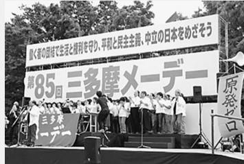
昨年のメーデー舞台

東京土建は、いろいろな取りくみや運動がありますが、組合員・家族みなさんのご協力をお願いします。