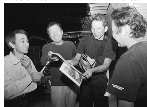
昨年行われた後継者の訪問行動

春の仲間づくり運動は、仕事とくらしの要求実現や、土建国保やどけん共済などの諸制度の維持と改善などに向けた「仲間を増やす」ことを目的としていますが、もうひとつの位置づけは、『組織強化』です。