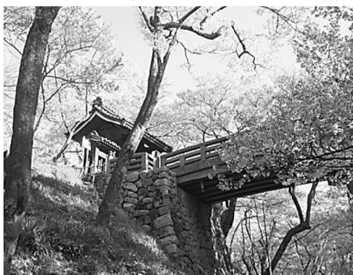
カラーでないのが残念な高遠城址の桜

【新川分会教宣部・江野宗太郎記】今回は、長野県伊那、城址公園に咲く「タカトオコヒガンザクラ」を紹介いたします。 「タカトオコヒガンザクラ」は、少し小さく赤みのある花が咲き、早春の城址公園が綺麗なピンクに染まります。 山に囲まれ 【新川分会教宣部・江野宗太郎記】今回は、長野県伊那、城址公園に咲く「タカトオコヒガンザクラ」を紹介いたします。た伊那盆地、名峰アルプスの残雪と山間に咲く高遠城址の桜は見事です。