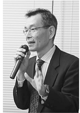
講師の松広常駐中執

救助隊の役割」と題したDVDを鑑賞しました。DVDには、阪神淡路大震災から学ぶ救助