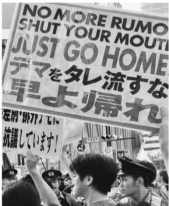
先月25日に銀座で行われたヘイトデモへのカウンター

今回は相模原市の「やまゆり園」の事件から見ると、イトクライムについて考えてみたいと思います。m