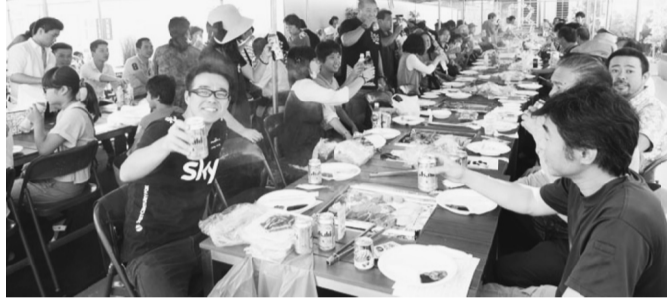
仲間づくり運動の成功のためにカンパイ