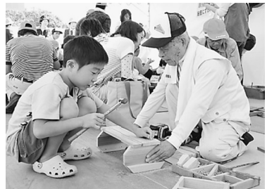
子どもに大人気の工作教室