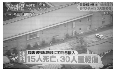
各マスコミが事件を伝えたが

お土産にスイーツの店に立ち寄り、両手で持つのもやっとうという人もいました。また、帰路へのバスの車内では、お楽しみ品のビンゴ大会を行い、大盛り上がりでした。