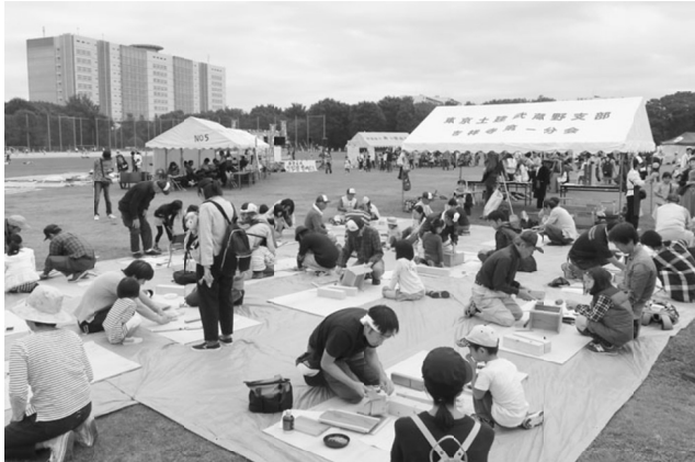
ちびっ子大工さんが工作を楽しむ

【荒木大輔書記】第34回むさしの子どもまつりは、10月16日の日曜日に開催されました。会場となった武蔵野中央公園は、気持ちがよく、素晴らしい秋晴れの1日となりました。