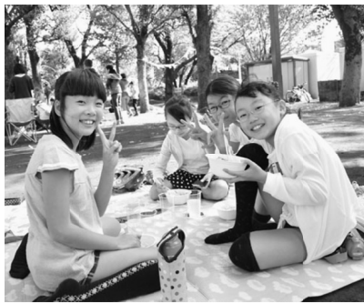
おいしいご飯とお供にピース

【田中実行委員長談】米づくりに体験の収穫祭を、11月6日(日)に、三鷹市農業公園で行い、7家族と後継者部員・支部役員など35人が参加しました。