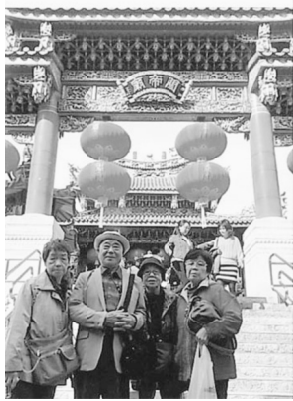
中華街のなかにある関帝廟の前で

湾岸線、中央環状線、山下で下車、最初に向かったところは横浜赤レンガ倉庫で自由散策。公園では、第2回ふ