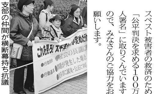
支部の仲間が横断幕持ち抗議

事務局のホームページにおいて事業者登録を行うことを必須としています。 活用を希望する事業者は、国交省のウェブサイトで公開され、事業活用を検討する消費者の業者選びを後押しすることが期待されます。下記の日程で説明会が開催されますので、制度を活用しようと考えている組合員・事業者の方は、参加してください。