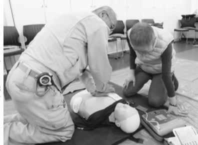
AEDの扱いも学びました

開催を予定していますので、災害時だけでなく、現場でも万が一の時に役に立つ、救命講習として、今後も開催しますので、みなさんの受講をおすすめします。