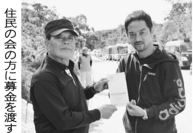
住民の会の方に募金を渡す

連日SNSで拡散される動画に胸が潰れそうだった。直ぐにでも駆けつけたいと悶々とした日々を過ごしていた時、書記局研修で高江に行くことが決まり、工事を止めるための頭数になれることが嬉しかった。 ノグチゲラやヤンバルクイナなどの特別天然記念物や絶滅危惧種が息する生物多様性の宝庫で、高江の150人の住民は共存している。 全国から集められた500人の機動隊員が、座り込んでいる私たちを排除する。非暴力で権力の横暴に抵抗する唯一の手段が「座り込み」。掴まれるだけで内出血するような屈強な指。踏まれれば骨折しそうな硬く重い革靴。怖かった。いま、ここは無法地帯。14か月かかるとされた工期をたった5か月で終えるため、土止めなど行わずに、急ピッチで進められている。12月20日には北部訓練施設の返還式典が予定されているからそこにはいる。「命どう宝」沖繩の反戦平和運動のローガン。 原発も基地も東京で引き受けたらいい。そうすれば沖繩の苦しみはわかる。高江での暴挙を許せば、今後全国で同じように、政府によって言論を封じられ、暴力で排除されるだろう。 これは、沖繩の問題ではない。日本の問題なのだ。ただどウチナンチュは自分たちの苦しみを他の人には押し付けたくないという。対立をうみたくない、一人ひとりができることをしてくれればいいと言う。その懐の深さに、もう一度ここに座り込みに行こうと決めた。参加した書記局の心に高江のこと、沖繩の人たちのことが刻まれた。現地に行くことで、現実を見ることの大切さも学んだ。 いま、支援の輪は全国に広がっている。ここから民主主義を生み出そうとする人々がそこにはいる。「命どう宝」沖繩の反戦平和運動のローガン。