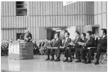
各政党が壇上であいさつ

【社保対部発】11月22日、東京土建などの建設国保の予算要求と、仕事と就労の改善に向けた東京都に対しての集会を午前中に東京都庁で開催。また、全国集会として、「賃金・単価引き上げ、予算要求集会」を、午後には日比谷野外音楽堂で開催しました。集会には、全国48県連・組合から3205人(東京土建1315人・支部から26人が参加しました。