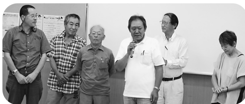
出陣式で達成を誓う上連雀分会の仲間たち