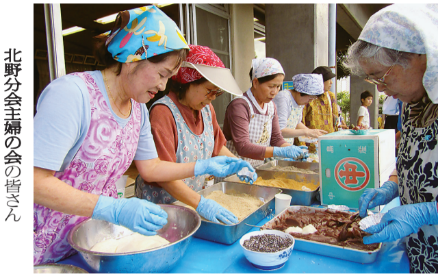
北野分会主婦の会の皆さん

【井の頭分会 油井義二記】 我々の、井の頭分会は殆どが現場での作業者です。その中で分会の若手を見渡したところ、何と若手の方が建設業での3Kと言われる「きつい」「汚い」「危険」の土木関係の作業に携わっていることに気づきました。 近年は、機械化での作業も可能になりましたが、建