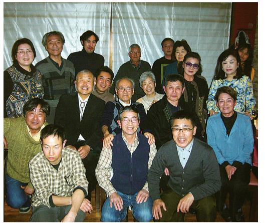
井の頭分会の皆さん