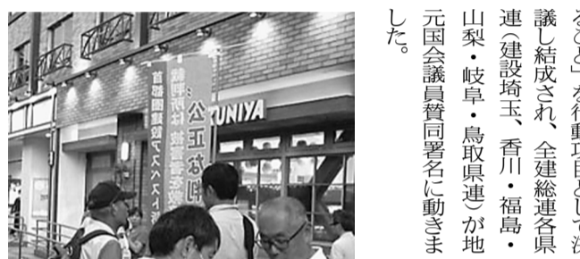
立ち止まり署名に協力も

【労対部発】「建設アスベストの早期解決をめざす全国決起集会」を5月22日、日比谷野外音楽堂で開催し、全国から3076人（東京土建1933人・三鷹武蔵野から40人）が参加しました。 アスベスト被害は深刻な問題で、訴訟団のなかでも多くの仲間が解決を前に亡くなっています。本日に早期解決が求められるなか、大阪地裁結審（5月26日）、京都地裁結審（6月1日）に合わせて、全国決起集会を開催。 今回の全国集会は、建設産業界におけるアスベスト被害の広がりを告発し、早期解決にむけて世論と政治を動かす契機となり成功しました。また、建設アスベスト訴訟は、両地裁の判決日（大阪・京都）も決まり、そこに向けて法廷内外のたたかいの山場を迎えます。 アスベスト被害の根絶、これ以上の被災者を出さない取りくみは、政治による早期解決の実現をせまり、運動を構築していくことが求められて