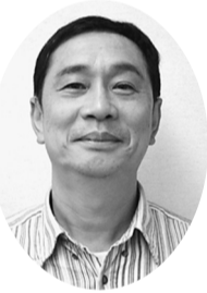
【佐渡社保対部長記】東京

土建国保に加入している本人と19歳以上の家族は、無料で健康診断を受診することが出来ます。病気の早期発見・早期治療は、健康を守るのにももちろん、医療費の削減や、保