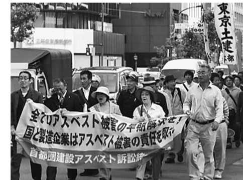
集会後に原告団を先頭にデモ行進

利に向けて、駅頭宣伝を行いました。 私たちの訴えに、家路を急ぐ人たちは、チラシやティッシュを受け取り、署名も多数いただきました。引き続き、建設アスベストの早期解決をめざす取りくみは、私たち建設業に