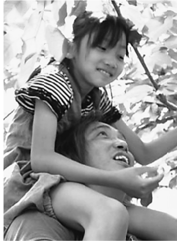
楽しくさくらんぼ狩り

当初雨の予報でしたが、晴天に恵まれ、少し暑いぐらいの天気となりました。午前中は中央道を通り、山梨でさくらんぼ狩りをし