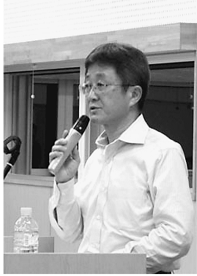
本部の年森書記次長が講演

【学習制度化発】6月16日の夜に三鷹市公会堂さんさん館において分会四役・群三役学習会を行いました。参加者は77人と、合併してはじめての学習会は大勢の参加で開催することが出来ました。