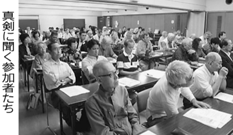
真剣に聞く参加者たち