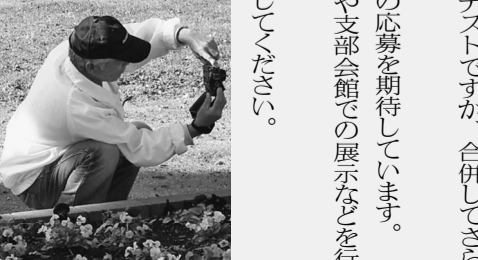
大切な実感しました。

応募については、左記の要綱を参考にしてください。多くの方の応募を期待しています。入選作品は、支部機関紙「みちしるべ」の来年1月号への掲載や支部会館での展示などを行います。もちろん賞品も用意しています。