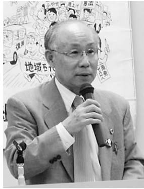
宇都宮弁護士の話に参加者は納得

「反対」をしているなか、武三地区労の怒りの総行動が、6月9日の夜に武蔵野公会堂で開催されました。