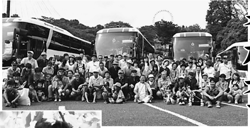
参加者全員の写真は庄巻