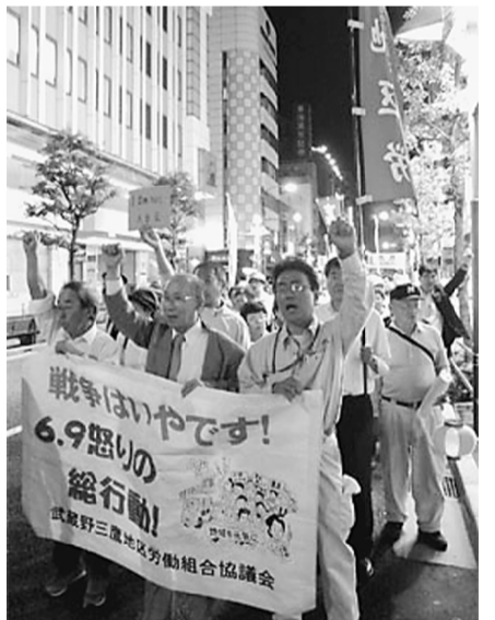
地域から声を上げようとアピール