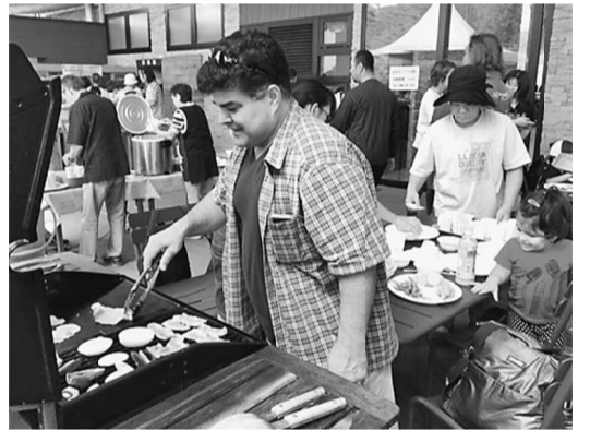
BBQはみんなお手の物

肉や野菜、焼きそばなど好きな食材を汗だくで焼き、すごい熱気でした。その後は自由行動となり、遊園地エリアやアスレ