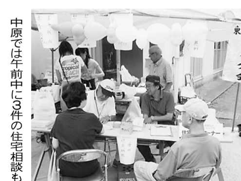
中原では午前中に3件の住宅相談も