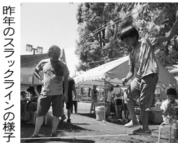
昨年のスラックラインの様子