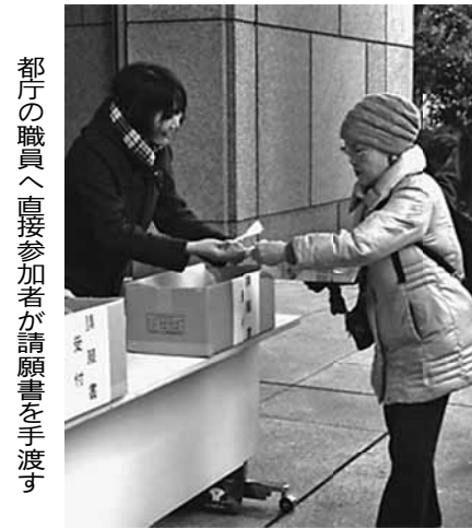
都庁の職員へ直接参加者が請願書を手渡す

各政党とも予算確保すると発言 11月25日の午後、雨が降りしきるなか、「賃金・単価引き上げ、予算要求中央総決起大会」が開催され、組合の5310人(東京土建1977人・武蔵野支部43人)が参加しました。 国に対して、私たち東京土建国保(全体では建設国保の予算確保に) 11月25日の午後、雨が降りしきるなか、「賃金・単価引き上げ、予算要求中央総決起大会」が開催され、組合の5310人(東京土建1977人・武蔵野支部43人)が参加しました。 国に対して、私たち東京土建国保(全体では建設国保の予算確保に)