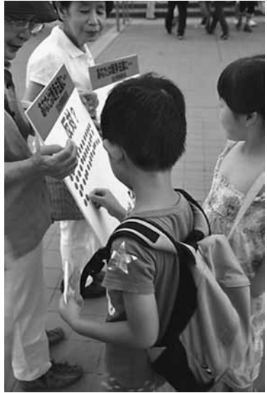
ボクは戦争反対と駅宣で

9月19日に強行採決された安全保障関連法は、国民の4割以上が法案に反対し、8割以上が成立の延期と世論調査のもとでの採決でした。自治体の状況を見ると、武蔵野市議会では、全国の自治体で4番目に法案反対の決議をした一方で、三鷹市議会は全国でも数少ない賛成の決議をした自治体と、両極端ではありますが、安全保障関連法が