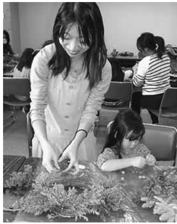
親子で一緒に楽しくリースづくり

◇映画・イベントなど「メイジャー」のHPで検索してください。 ※注文や問い合わせは、支部事務所0422-55-3200まで ※注：割引額は、前売券の販売価格から一律400円です。