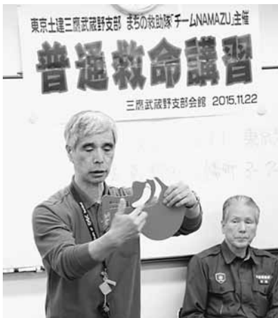
しっかりと楽しかった講師の話し