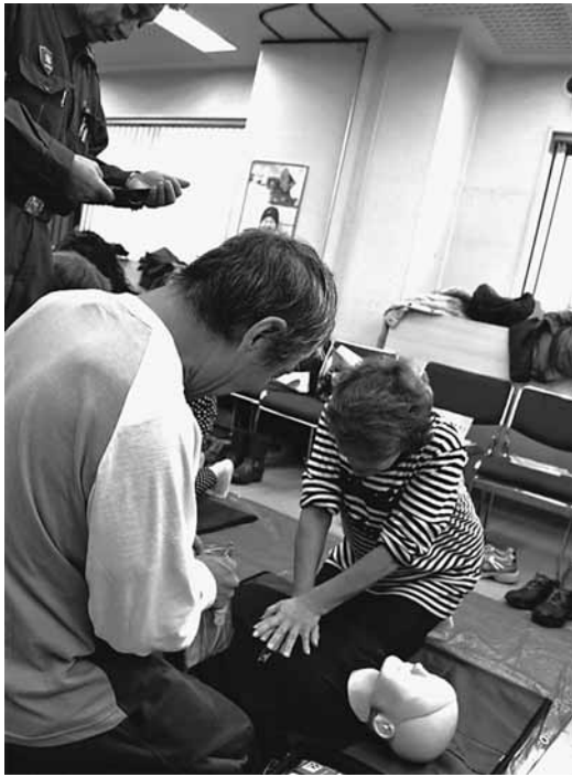
講義で聞いているより実際にやってみるとむずかしい

参加者からは、「現場で何かあった時にも役立つ」「多くの人が受講した方がいい」など好評でした。