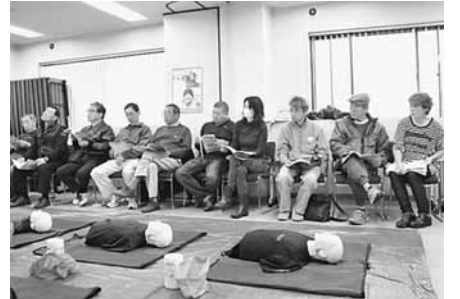
真剣に講師の話を聞く参加者

多くの組合員や家族の方がこの講習を受けられるよう、来年初旬の開催を検討していきます。