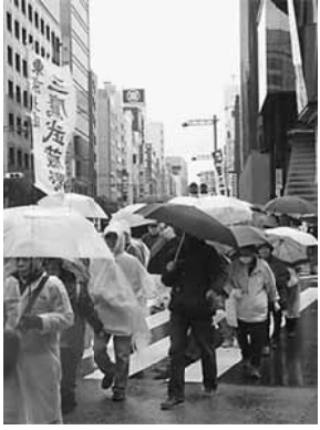
雨のなか銀座をデモ