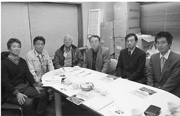
支部四役と共産党市議と懇談

「国民連合政府」について説明がされ、来年夏の参議院選に向けての政治動向や、運動について意見交換がされました。