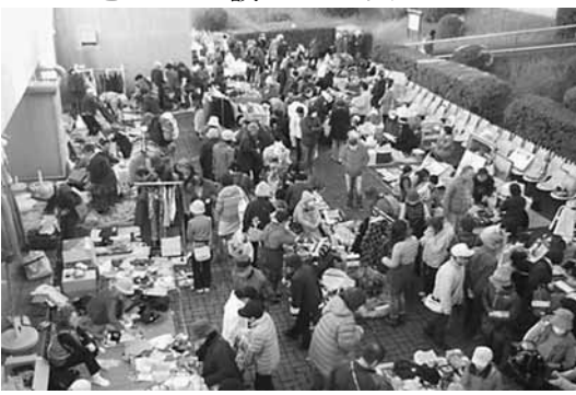
多くの来場者でにぎわう福祉バザー