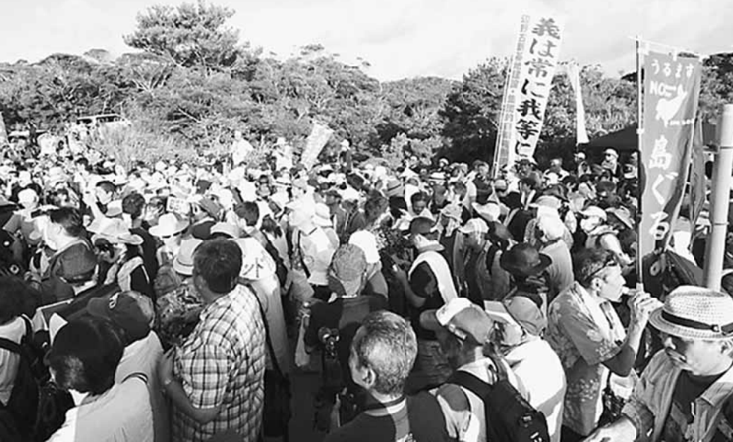
5日から6日の強制撤去の阻止にかけつけた住民と全国の仲間は約1000人に

選挙で何度も民意を示しても、一顧だにされないのは、どうしたらいいのかとも思う。いろんな意味もあるが、民主主義の国家において、基地が争点になった選挙で、現役の大員に対して10万票以上の