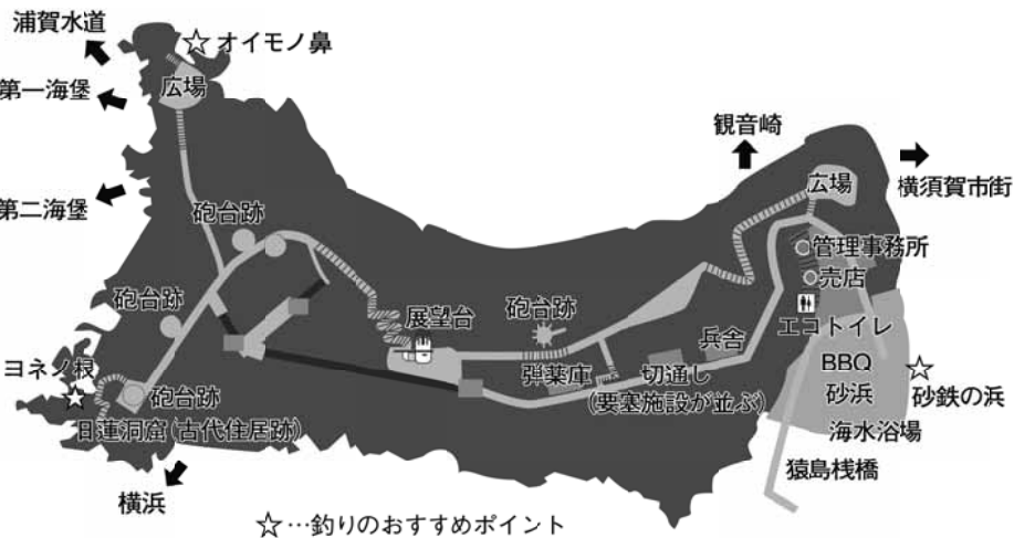
☆…釣りのおすすめポイント