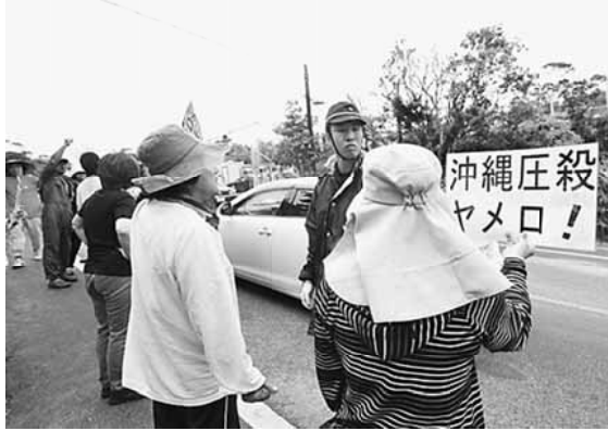
抗議しながら機動隊に話しかける住民たち