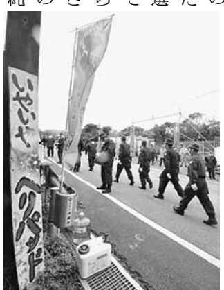
機動隊が住民を威圧する