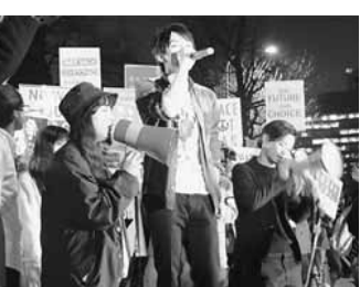
民主主義ってなんだ