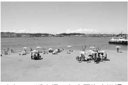
きれいで透き通った水野海水浴場