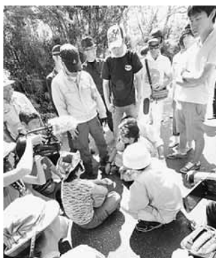
防衛局員に抗議する住民

「私たちは、この自然のなかで、普通に暮らしたいだけ、それを望むのはおかしいことですか」と、N1ゲートの名称のメインゲート前で反対運動の市民を威圧している機動隊(大阪府警)の若い隊員に、地元の人が語りかけます。