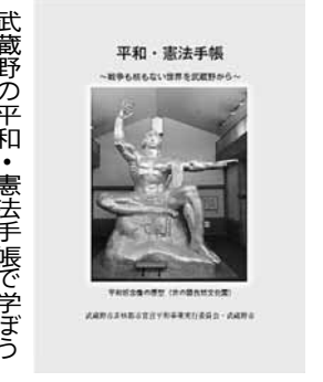
武蔵野の平和・憲法手帳で学ぼう

武蔵野市では、市の平和施策や武蔵野の空襲の歴史を知ってもらい、同時に日本国憲法や人権の大切さを再認識してもらうためとして、「平和憲法手帳」が作成されました。それぞれの自治体が入力している『平和事業』を利用して、「平和」を広めていきたいと思います。