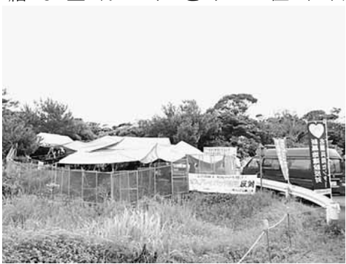
危険なヘリパッド建設に反対する市民と、全国から連日4000回以上も、離発着を繰り返している。

4日から6日の日程で現地には2台のレンタカーを放置して、反対派住民の妨害をしています。7月22日のメインゲートでの強制撤去と同様に、5から6日にかけて、機動隊を使って、強制撤去が行われるのではないかと、全国から5日には1000人を超える住民が結集しました。その日のN1裏テントは日々大きくなっている