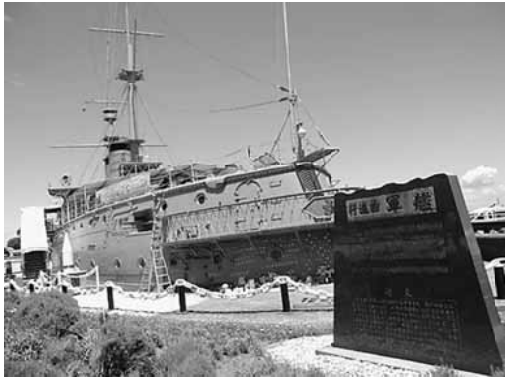
船乗り場横には軍艦みかさ

※横須賀の「三笠棧橋」から船で10分。乗船料は、大人1300円、小学生650円、小学生未満無料。他に入園料が、大人200円、小・中学生100円。