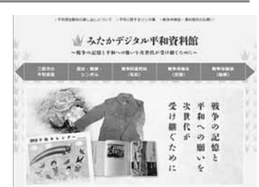
三鷹のHPにある資料館

定がされていること、私がいる間にも、軍用ヘリが昼夜を問わずに3基ほどで訓練をしており、夜11時まで無灯火演習をし、すごい爆音でした。オスプレイが地上30メートルほどの高さで訓練をするので、家の中まですごい振動と音があり、子どもが寝られず避難して学校に通う家庭もあるほどです。