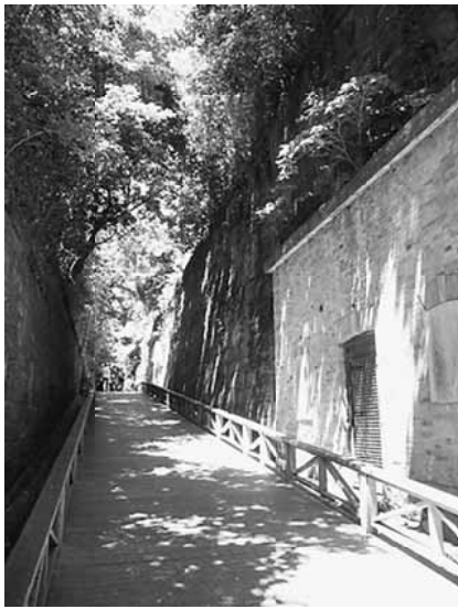
切通しにある要塞跡

『猿島』です。猿島は、幕末から第二次世界大戦前にかけて、首都を守るための防衛拠点として、陸軍・海軍が東京湾要塞の猿島砲台を築造し、運用されていま