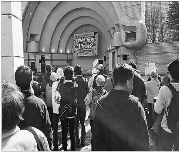
原発をなくそうと集まった人たち

【教宣部発】 3月7日「とめよう原発」集会が全国から集まった参加者8500人で行われました。今回の集会は「さようなら原発100万人アクション実行委員会」などの団体が中心となって結成された実行委員会が主催しました。 政府が進める原発の帰還政策や再稼働への動きに対し、改めてノーを突きつける場となりました。 各界の著名人が登壇して、原子力緊急事態宣言が解除されていない現状が報告され、